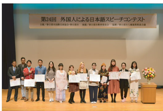
コンテスト参加者の皆さん